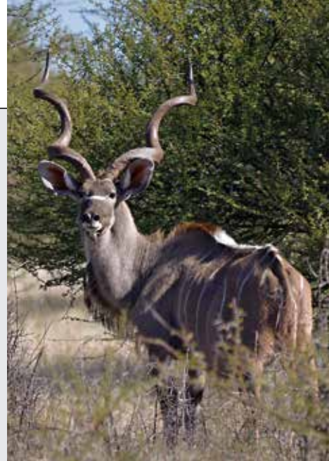
Enigiemand wat ’n klomp koedoes met horings van langer as 60 duim wil sien, moet na Pieter en Tjaart se koedoeteelprojek kom kyk.

Daar was egter niks wat hom beïndruk het